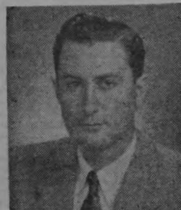
MINISTRO ROSSI ...asume Cartera de Obras Públicas...

Consignamos el Decreto Ejecutivo por medio del cual se re carga la Cartera de Obras Públicas al Ministro de Economía y Hacienda Lic. Jorge Rossi Chavarria, mientras dura la ausencia del titular don Francisco J. Orlich: