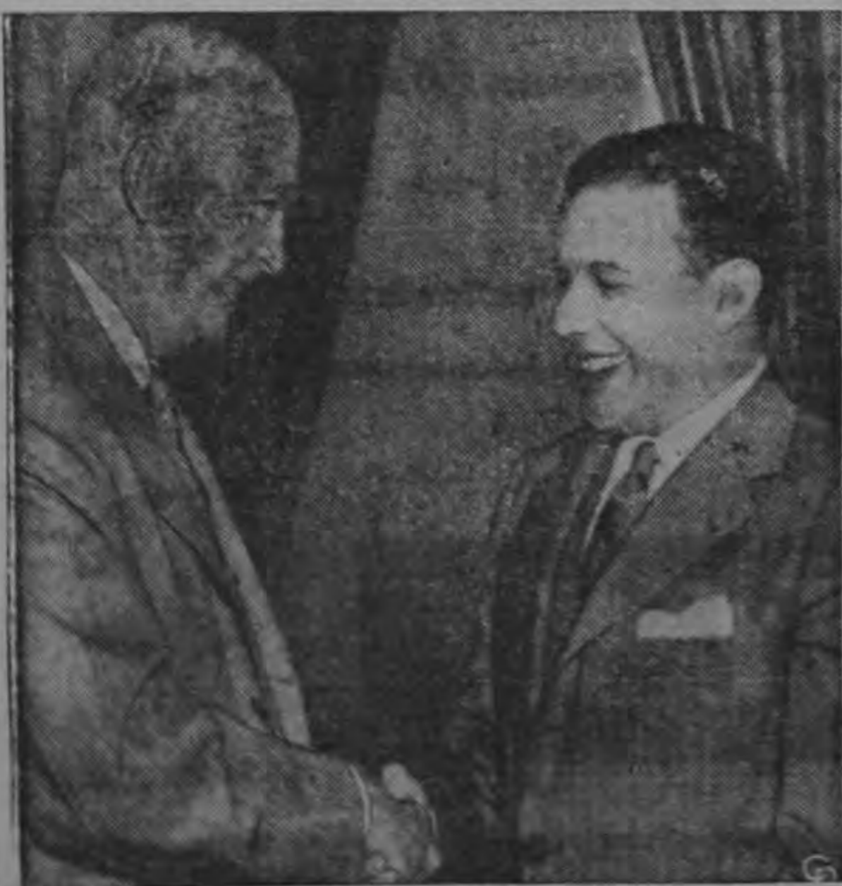
El Presidente Eisenhower estrecha la mano del Dr. Joao Goulart vice-presidente del Brasil en una entrevista en la Casa Blanca. Goulart está haciendo un recorrido por los Estados Unidos.

Eisenhower estrecha la mano del Dr. Goulart